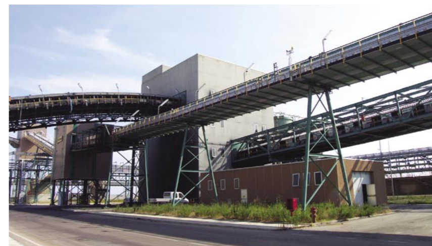
► I nastri del sistema di trasporto.

fica in linea i difetti superficiali nei nastri (buchi, tagli, lacerazioni), ne ricava le dimensioni e ne segue l'evoluzione. Attualmente in fase di sperimentazione presso la centrale termoelettrica di Brindisi Sud, il sistema utilizza le più avanzate tecnologie per l'analisi delle immagini e la localizzazione dei difetti.