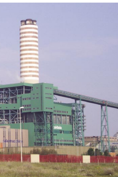
◀ La centrale di Brindisi Sud.